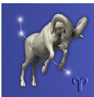
(Slunce ve 12.domě)

Kdo chce oživit a občerstvit svou víru (ve smysl, spravedlnost, prozřetelnost atd.), myslím, že pro to bude Beran příhodný.